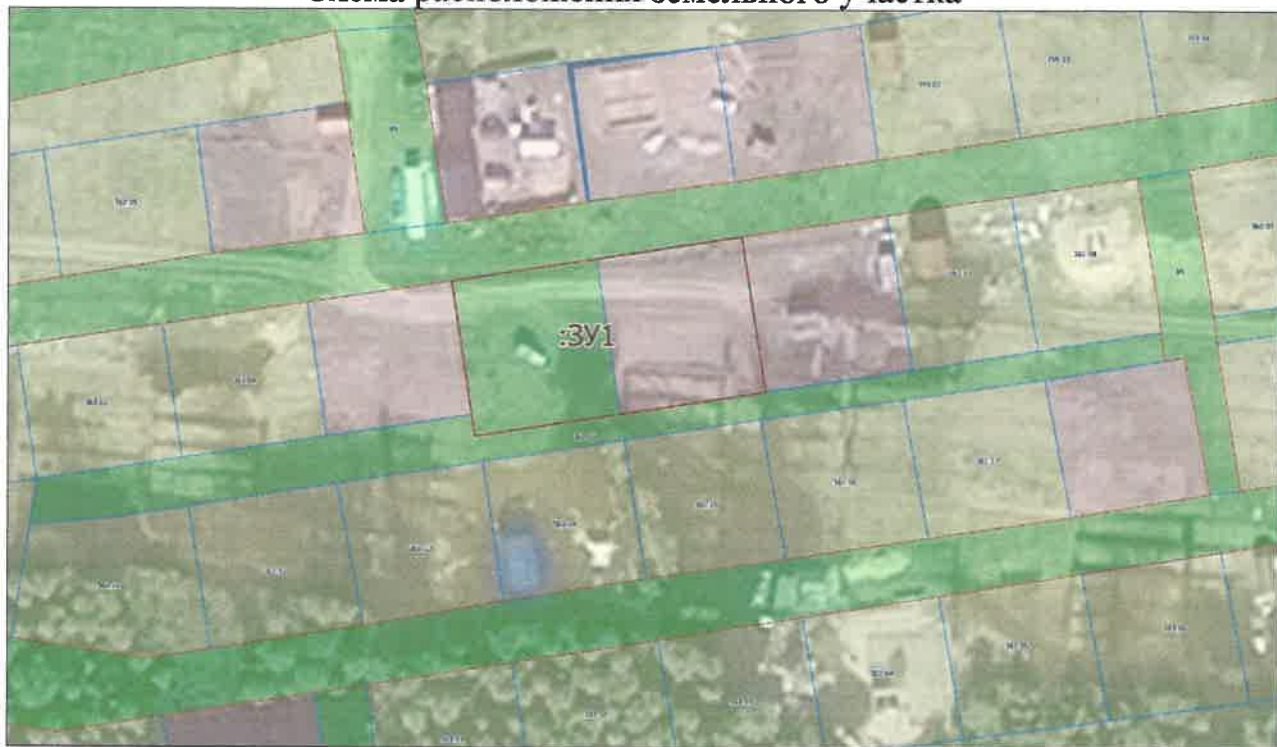
Схема расположения земельного участка