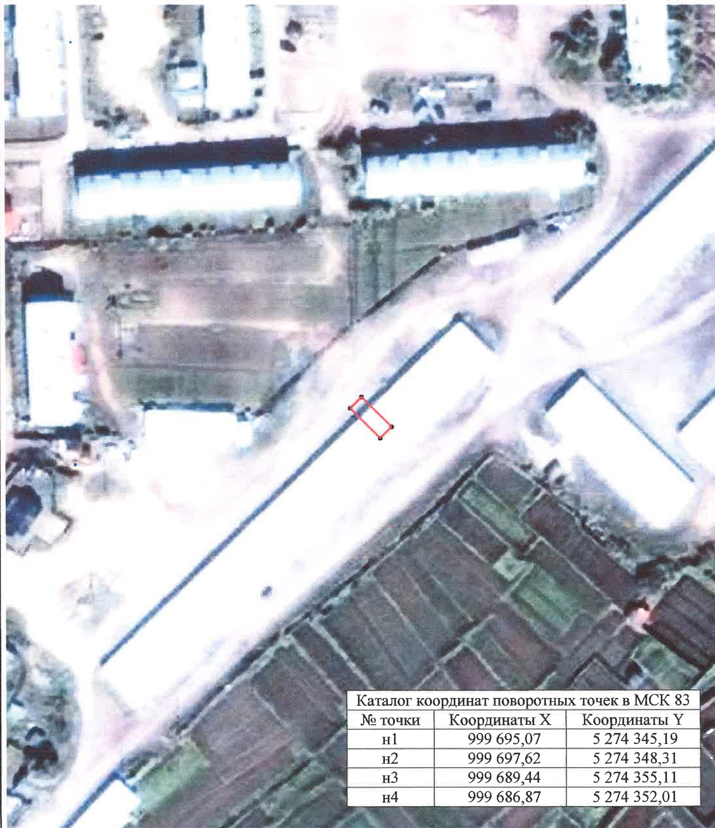
Каталог координат поворотных точек в МСК 83

Кадастровый номер исходных земель: 83:00:050302:75