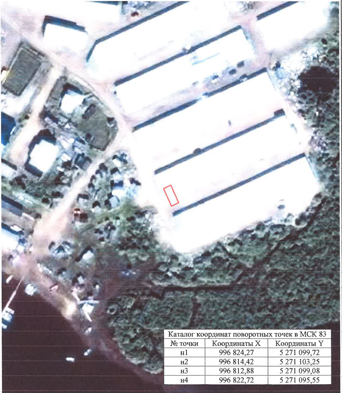
Каталог координат поворотных точек в МСК 83

Кадастровый номер исходных земель: 83:00:050019:13