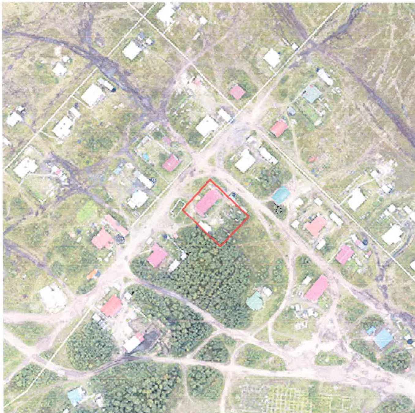
Каталог координат поворотных точек в МСК 83

Кадастровый номер исходных земель: 83:00:010007