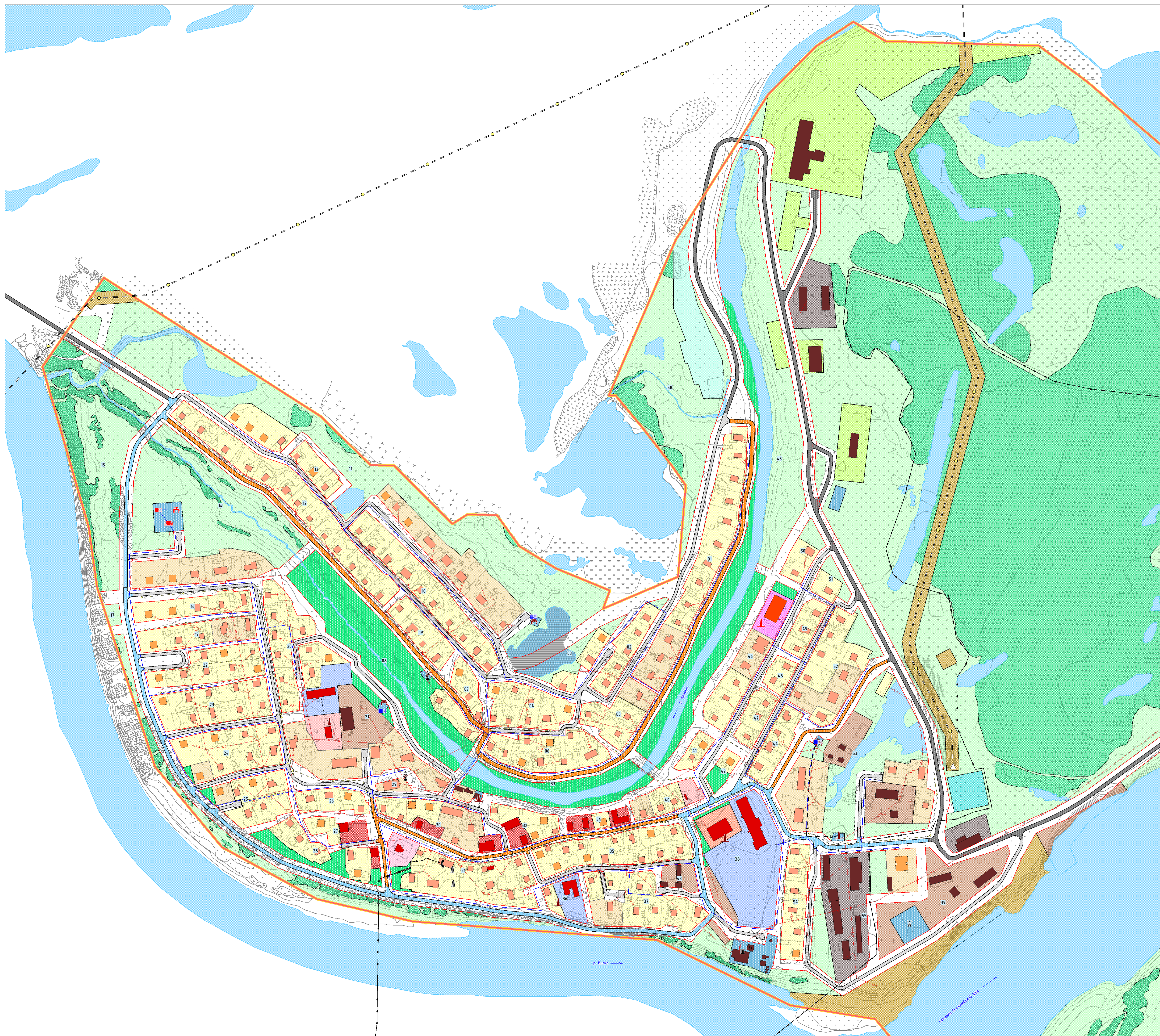
СИТУАЦИОННАЯ СХЕМА М 1:10 000