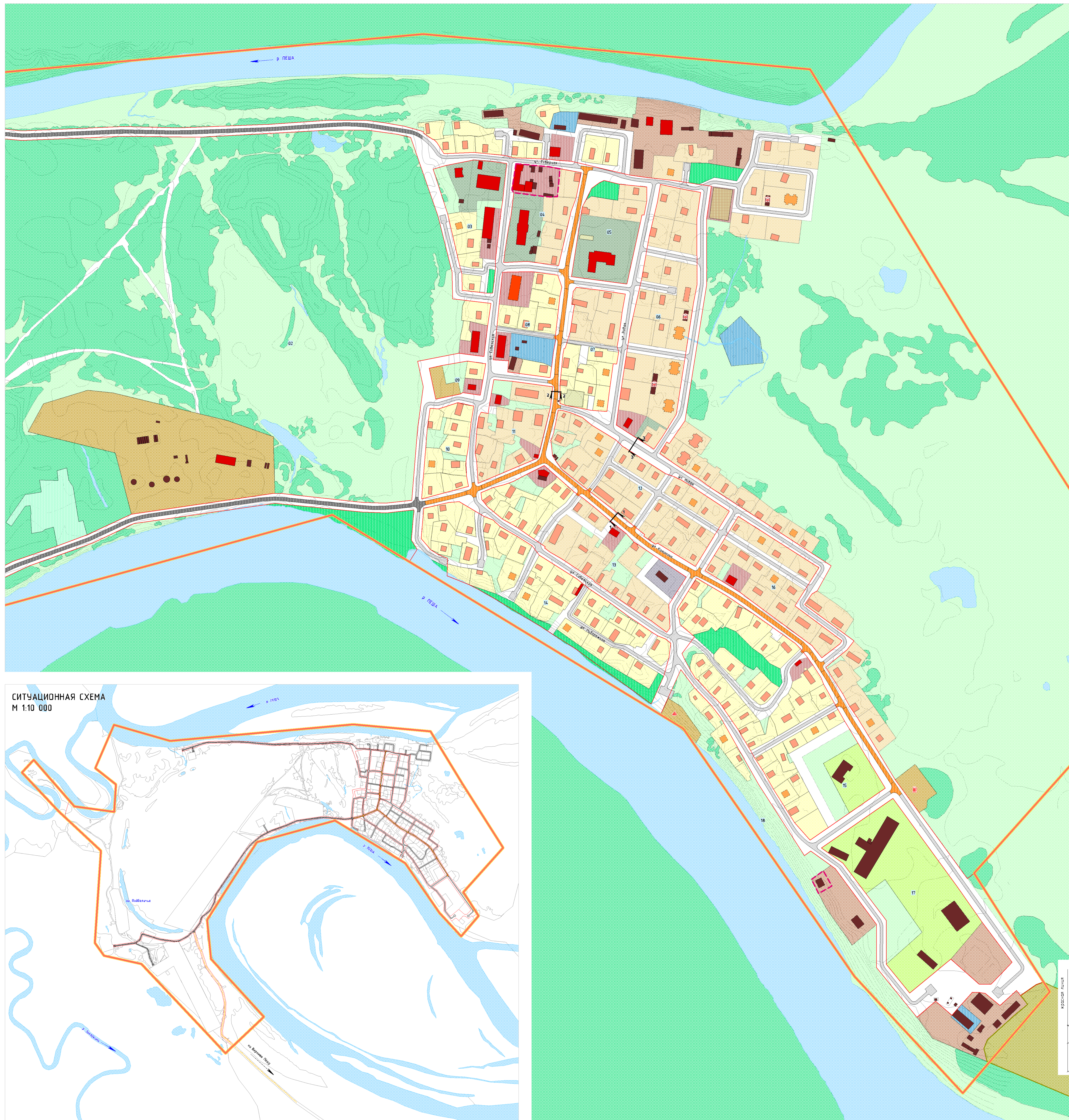
СХЕМА ОРГАНИЗАЦИИ ДВИЖЕНИЯ ТРАНСПОРТА И ПЕШЕХОДОВ. СХЕМА ОРГАНИЗАЦИИ УЛИЧНО-ДОРОЖНОЙ СЕТИ М 1:2 000