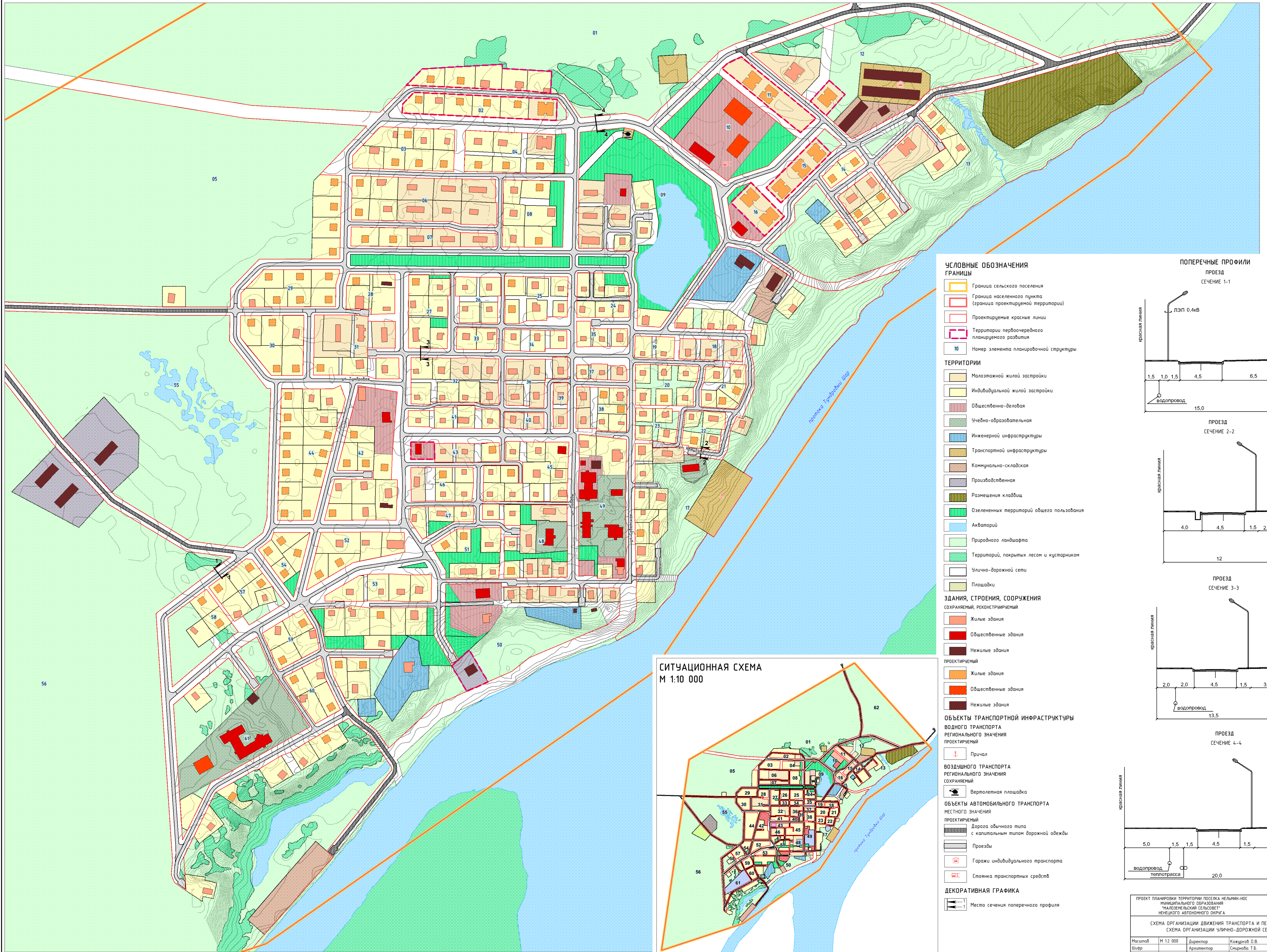
СХЕМА ОРГАНИЗАЦИИ ДВИЖЕНИЯ ТРАНСПОРТА И ПЕШЕХОДОВ. СХЕМА ОРГАНИЗАЦИИ УЛИЧНО-ДОРОЖНОЙ СЕТИ М 1:2 000