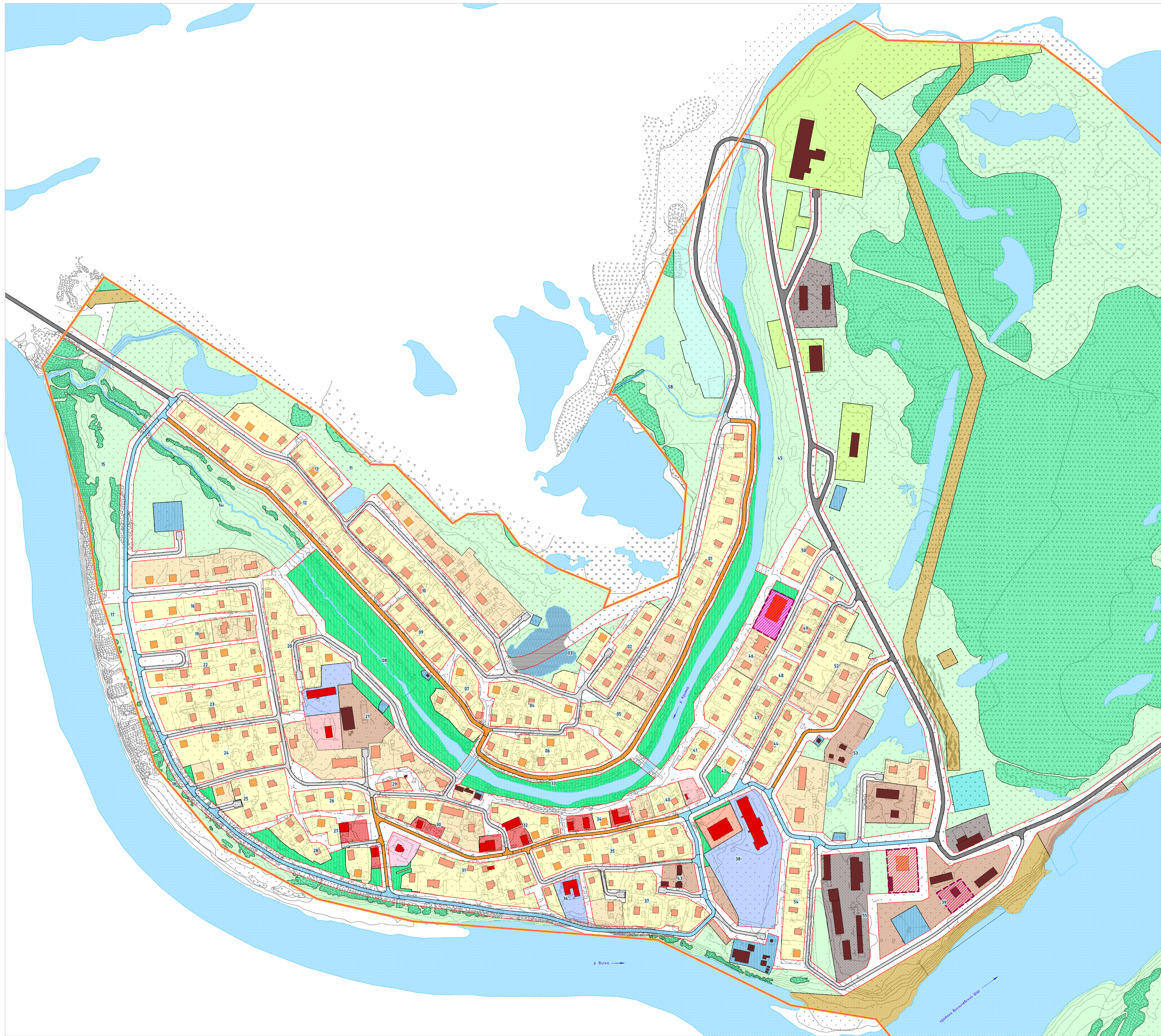
СИТУАЦИОННАЯ СХЕМА М 1:10 000