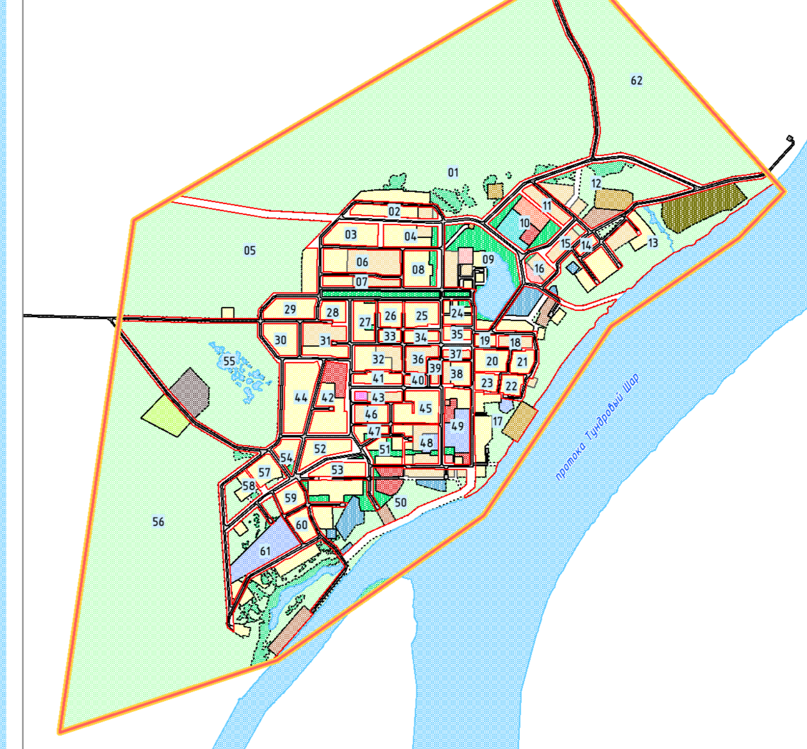
СИТУАЦИОННАЯ СХЕМА М 1:10 000