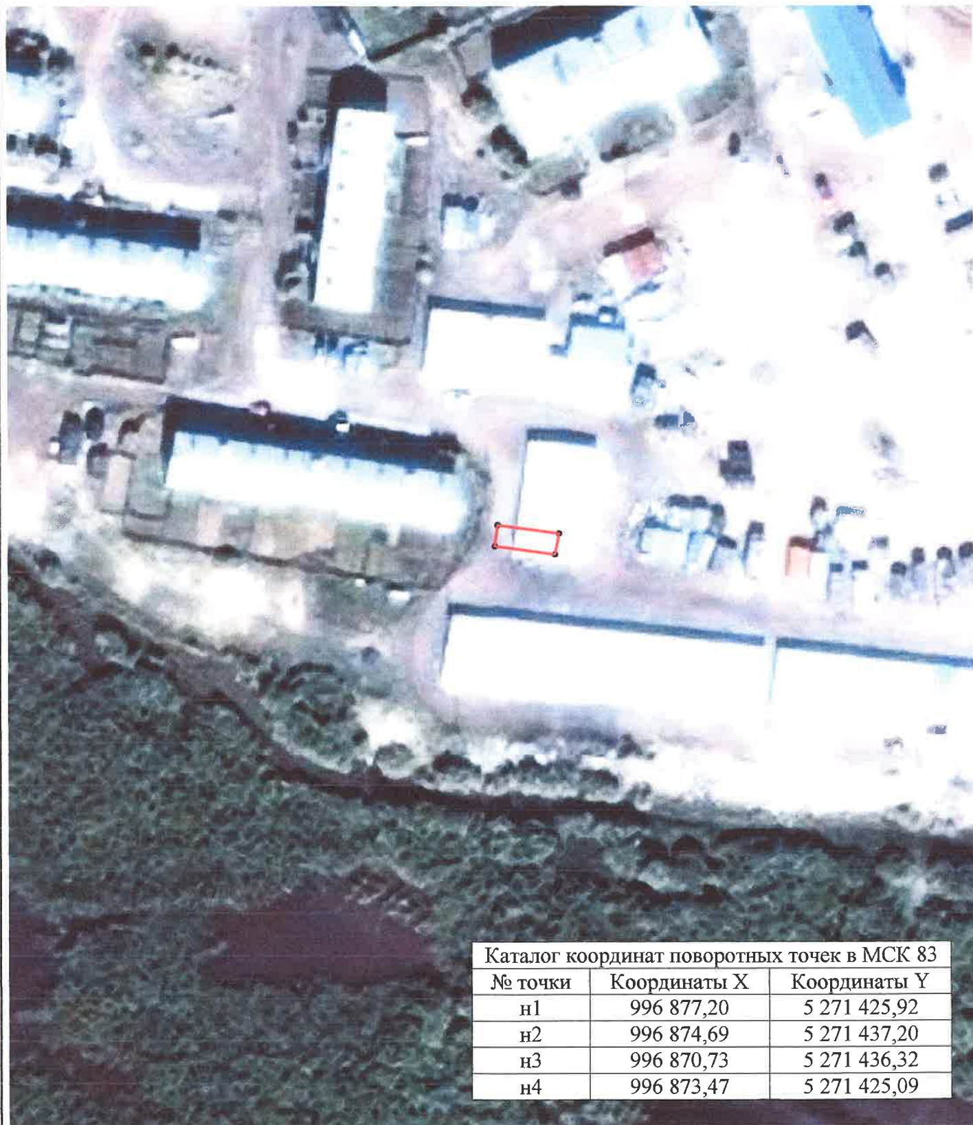
Каталог координат поворотных точек в МСК 83

Кадастровый номер исходных земель: 83:00:050013:21