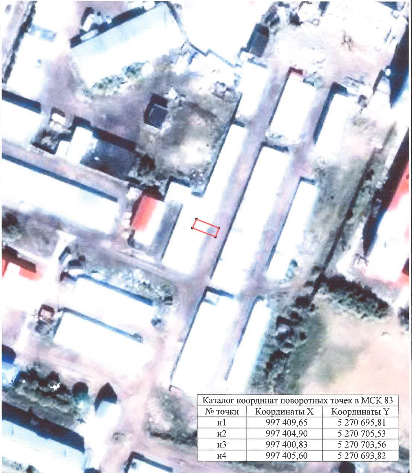
Каталог координат поворотных точек в МСК 83

Кадастровый номер исходных земель: 83:00:050010