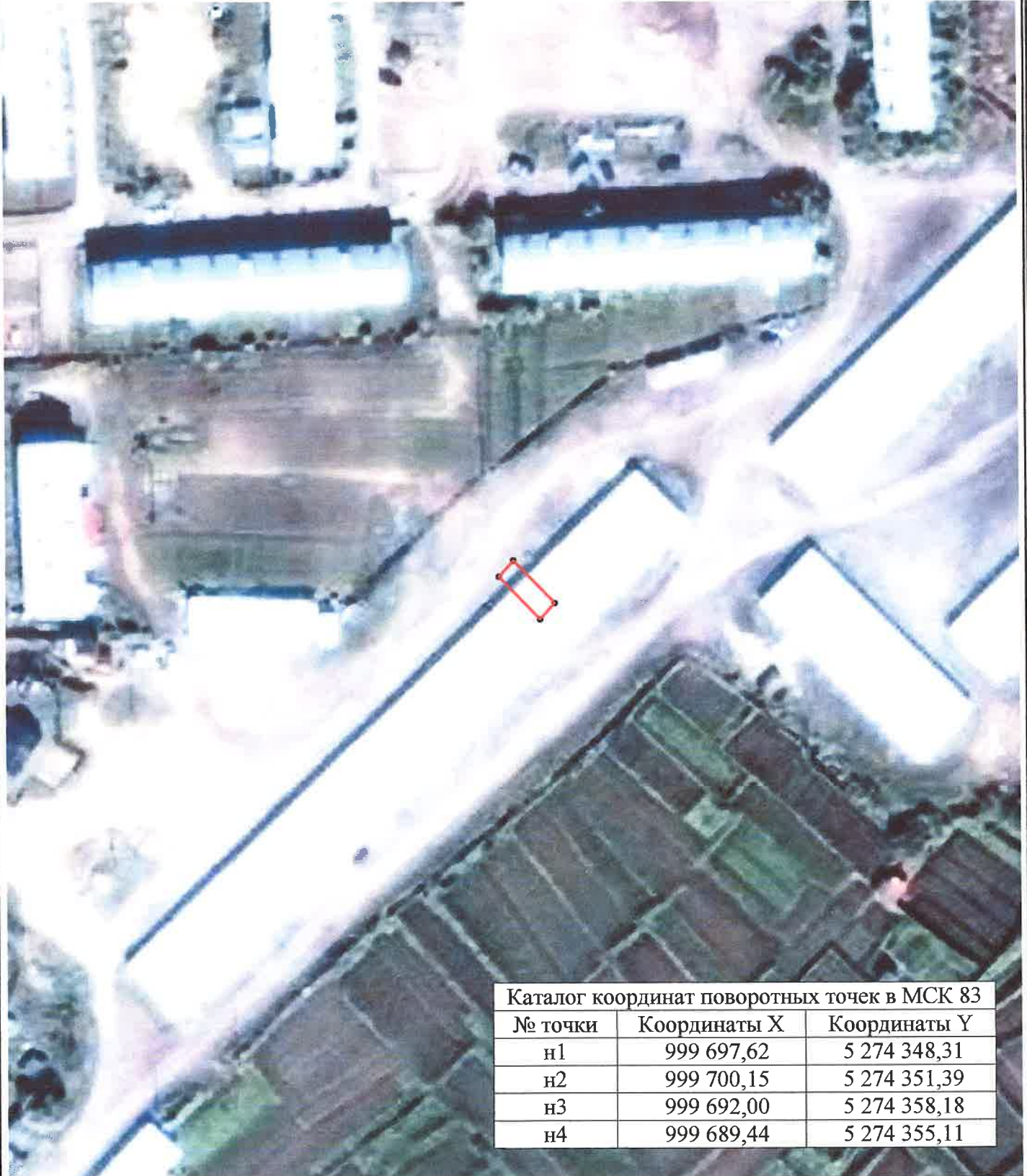
Каталог координат поворотных точек в МСК 83

Кадастровый номер исходных земель: 83:00:050302:75