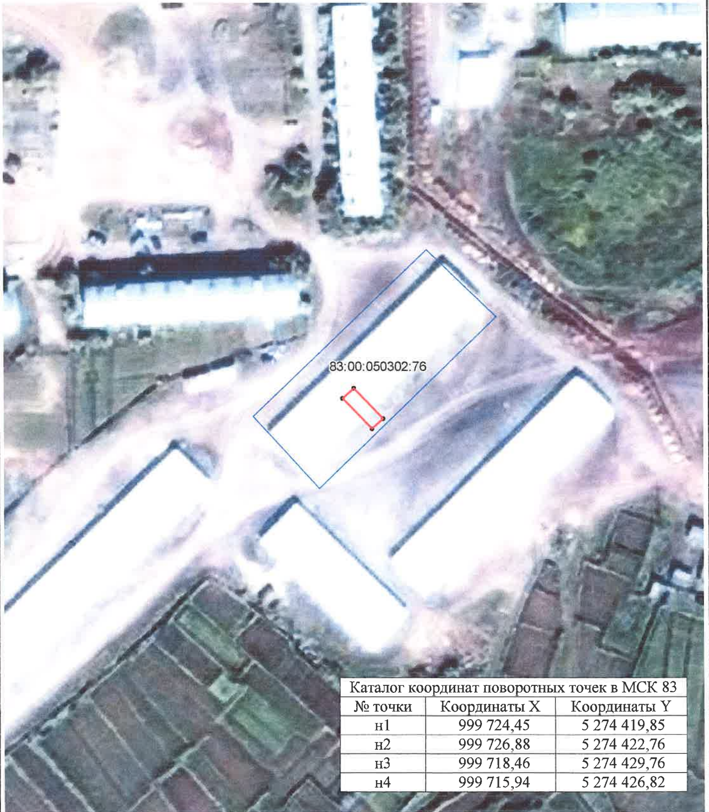
Каталог координат поворотных точек в МСК 83

Кадастровый номер исходных земель: 83:00:050302:76