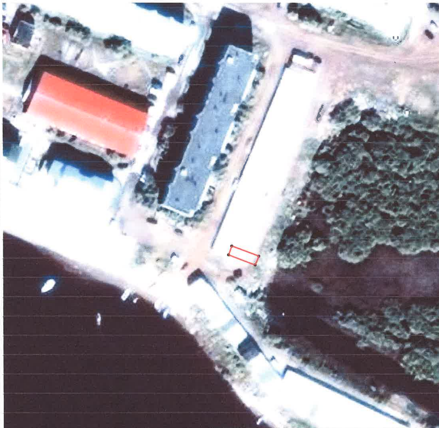
Каталог координат поворотных точек в МСК 83

Кадастровый номер исходных земель: 83:00:050010