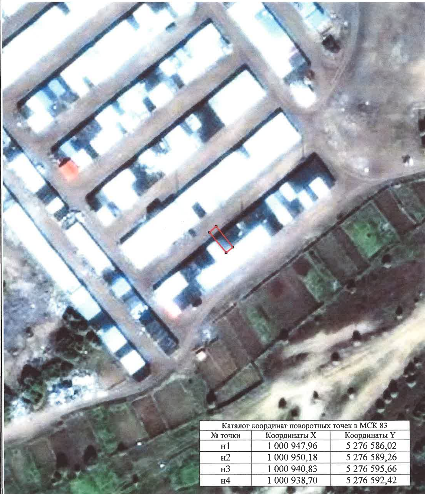
Каталог координат поворотных точек в МСК 83

Кадастровый номер исходных земель: 83:00:060006