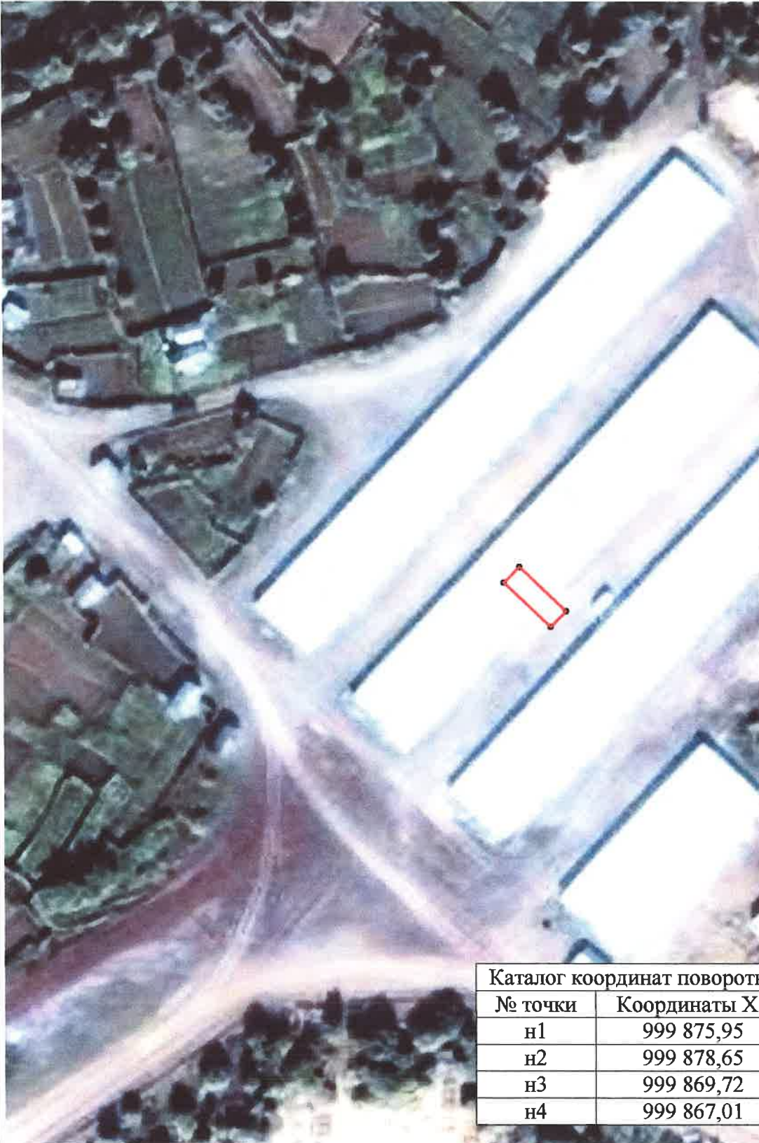
Каталог координат поворотных точек в МСК 83

Кадастровый номер исходных земель: 83:00:050305:54