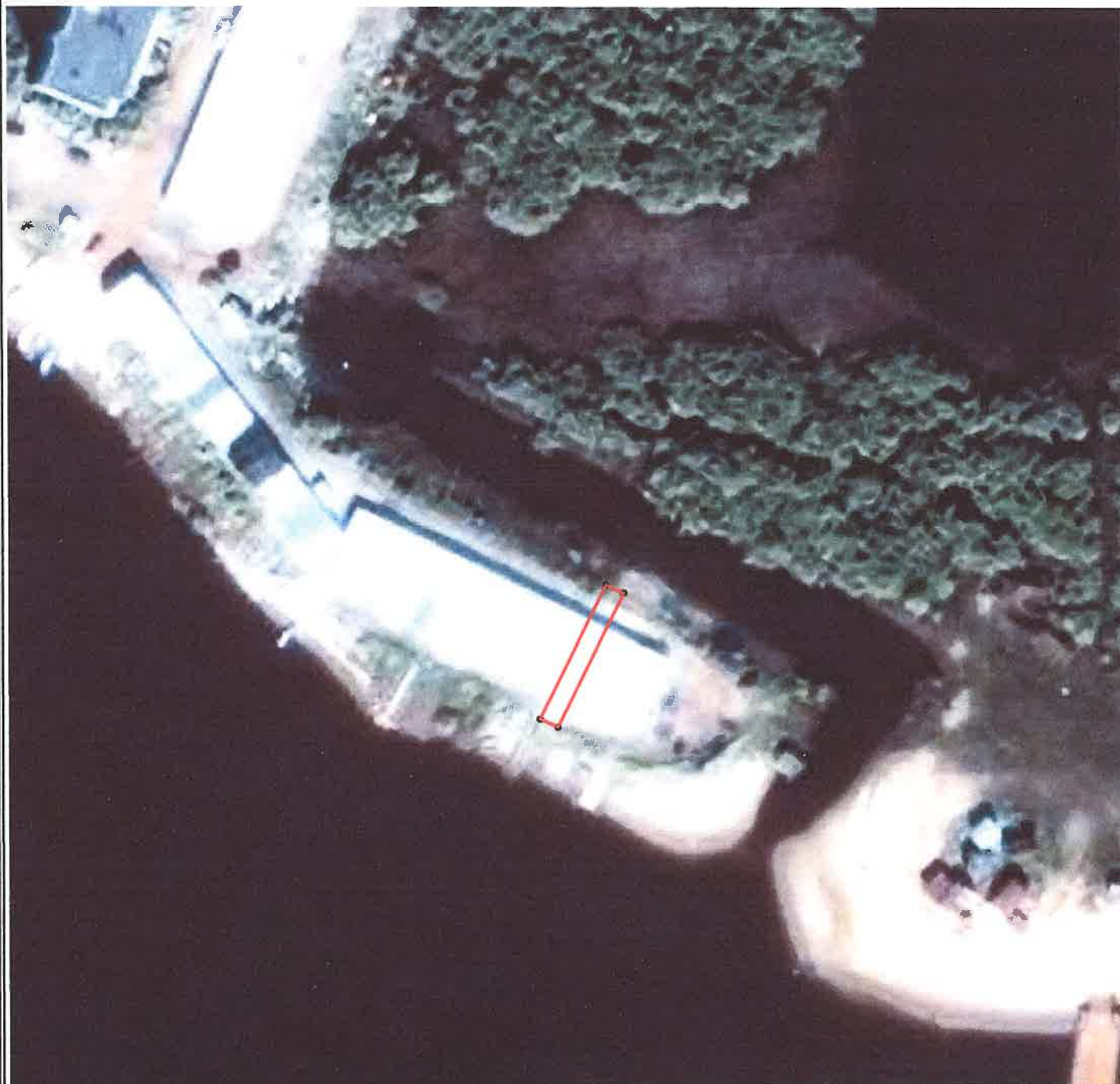
Каталог координат поворотных точек в МСК 83

Кадастровый номер исходных земель: 83:00:050010:41