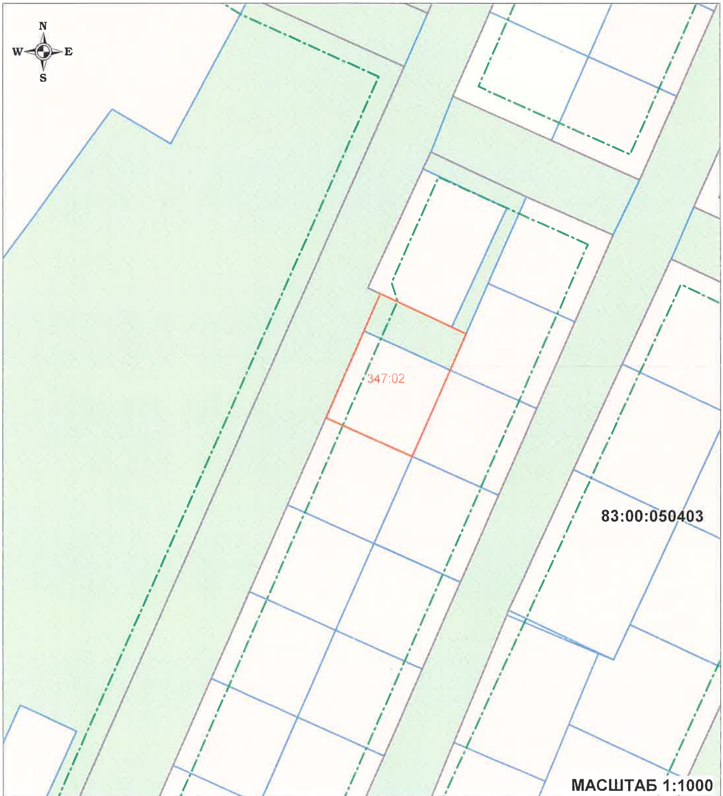
Схема границ изменяемой части проекта межевания территории муниципального образования "Городской округ "Город Нарьян-Мар" внесение изменений в планировочный квартал № 347 (образование земельного участка с условным номером 347:02).