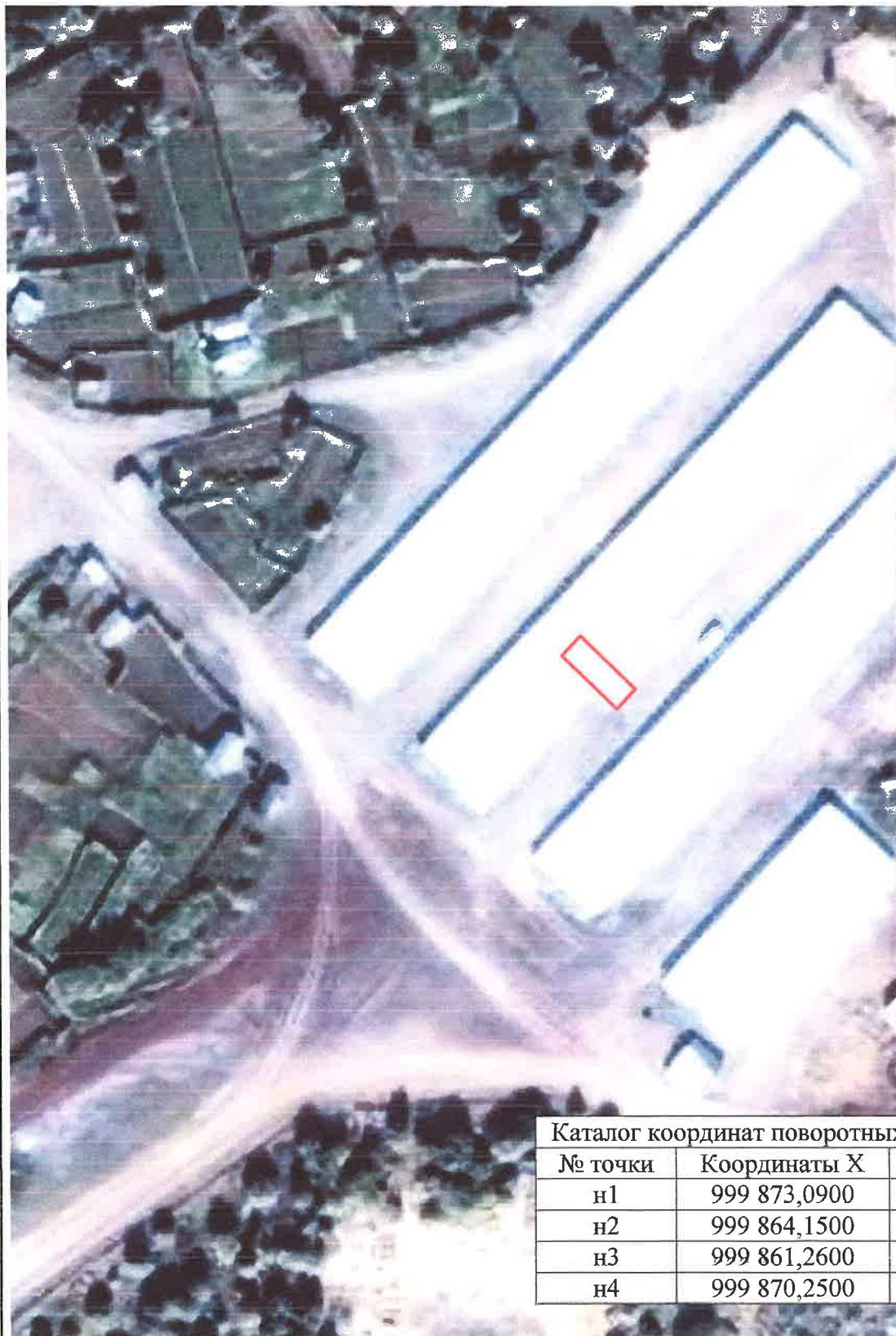
Каталог координат поворотных точек в МСК 83

Кадастровый номер исходного участка: 83:00:050305:54