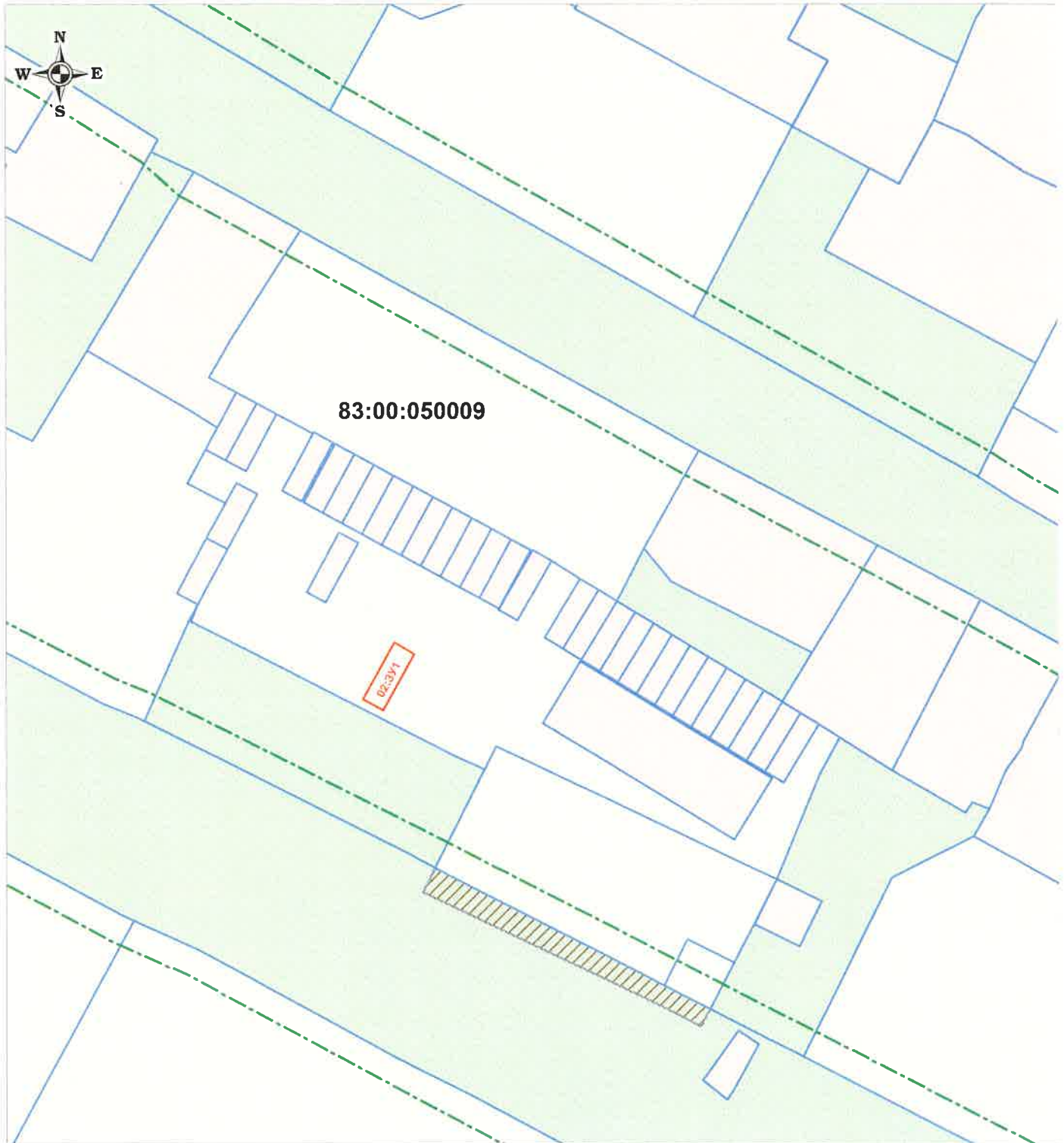
Схема границ изменяемой части проекта межевания территории муниципального образования "Городской округ "Город Нарьян-Мар" внесение изменений в планировочный квартал № 02 (образование земельного участка с условным номером 02:ЗУ1).