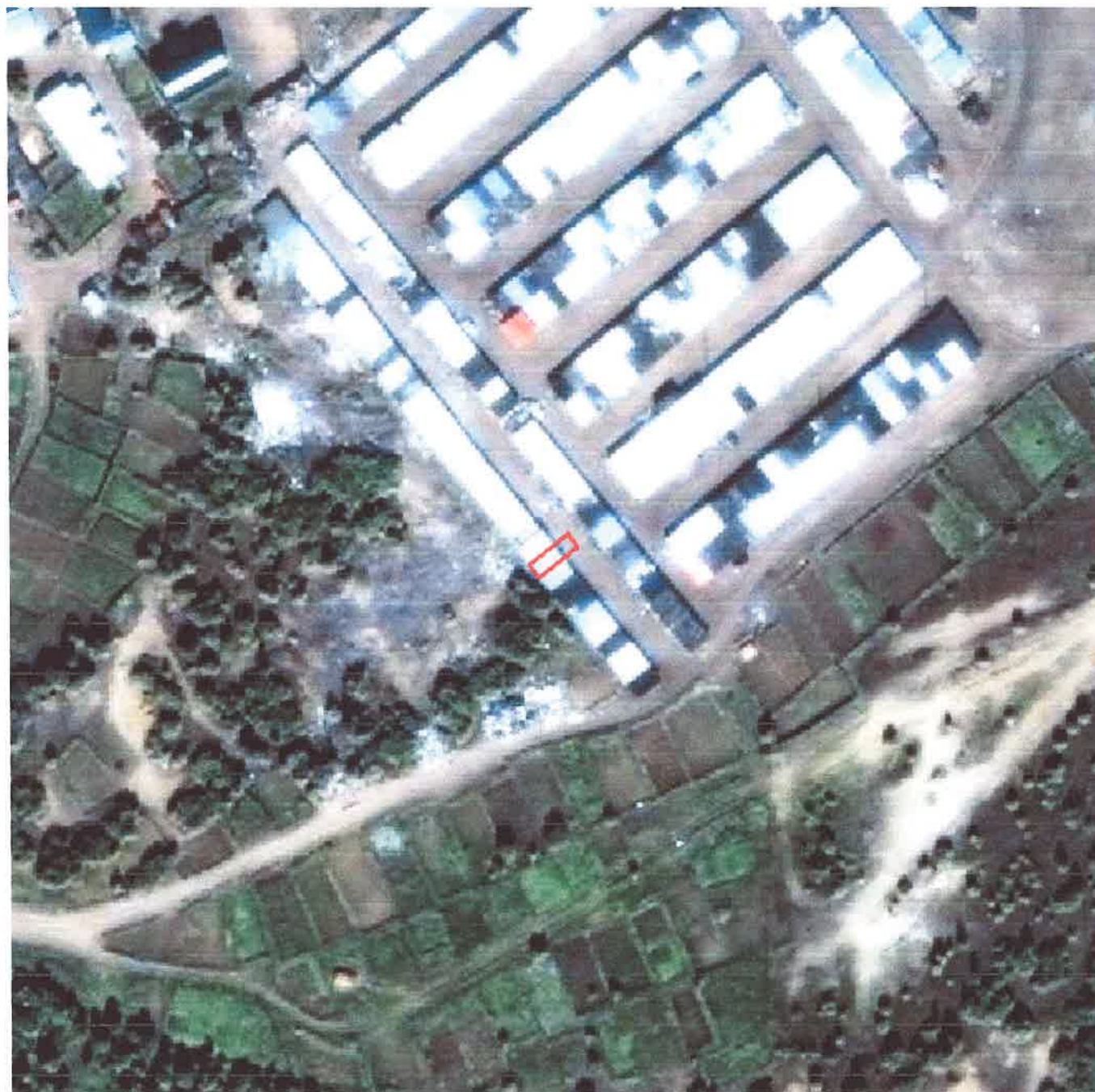
Каталог координат поворотных точек в МСК 83

Кадастровый номер исходных земель: 83:00:060006