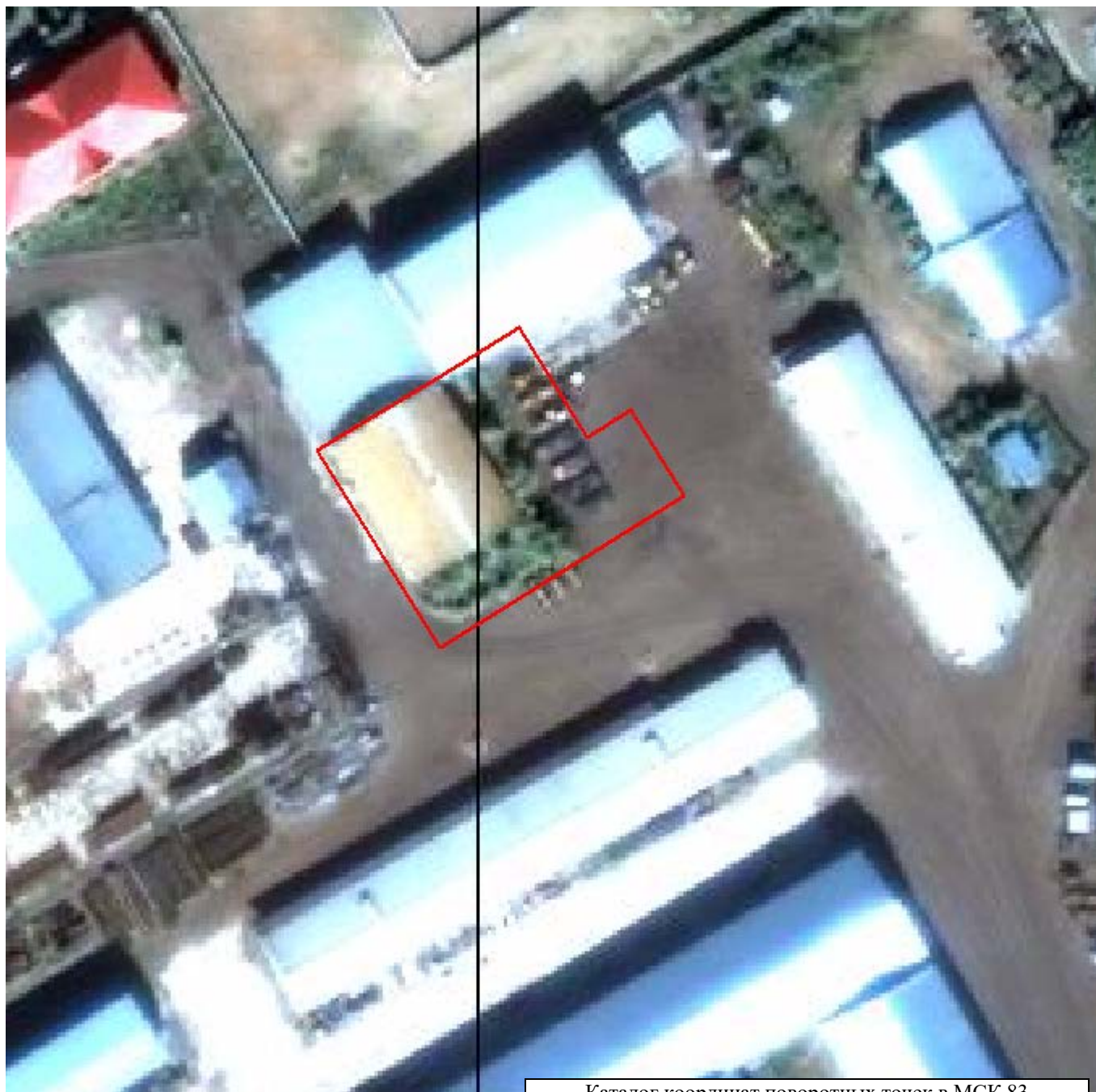
Каталог координат поворотных точек в МСК 83

Кадастровый номер исходных земель: 83:00:060104:55