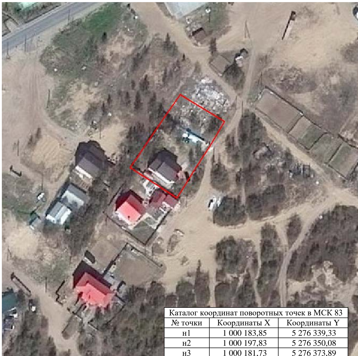
Каталог координат поворотных точек в МСК 83

Кадастровый номер исходных земель: 83:00:060009:323, 83:00:060009:324, 83:00:060009:93