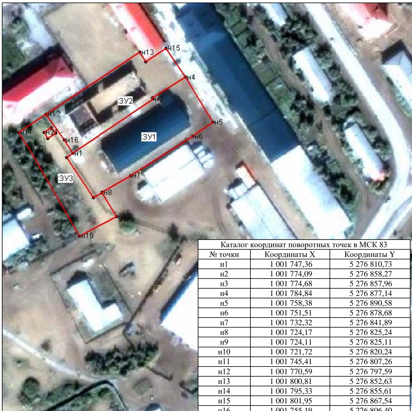
Каталог координат поворотных точек в МСК 83

Кадастровый номер исходных земель: 83:00:060104, 83:00:060104:33, 83:00:060104:303, 83:00:060104:142