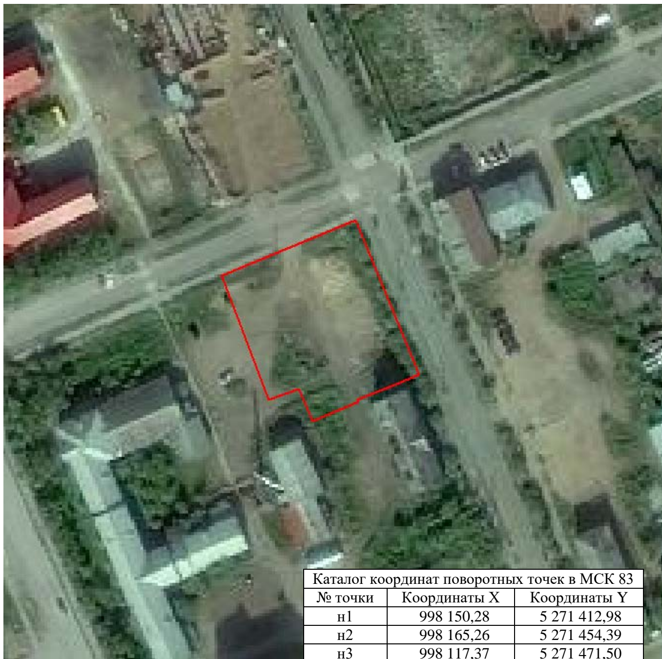
Каталог координат поворотных точек в МСК 83

Кадастровый номер исходных земель: 83:00:050003