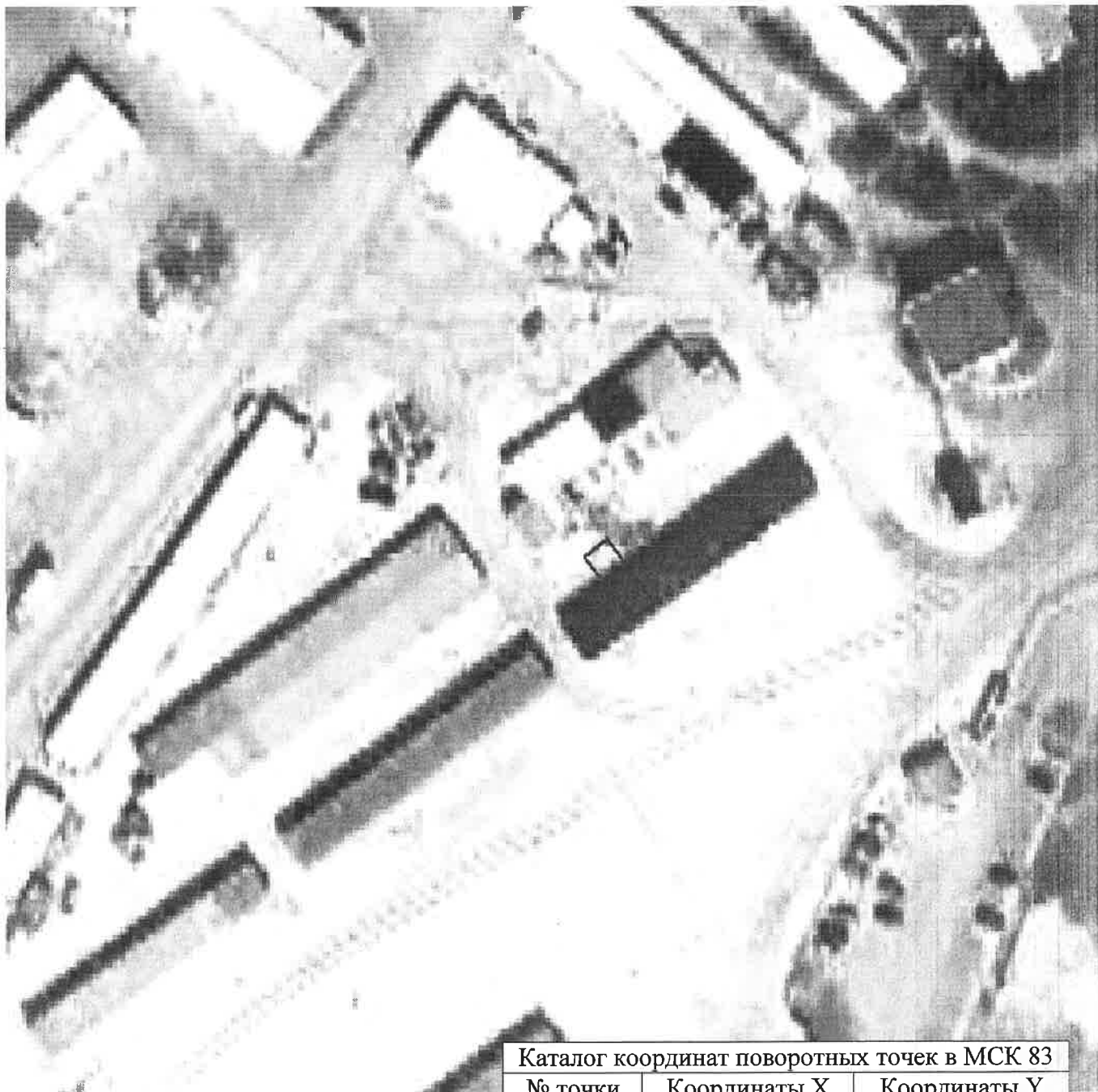
Каталог координат поворотных точек в МСК 83

Кадастровый номер исходного участка: 83:00:050002:135