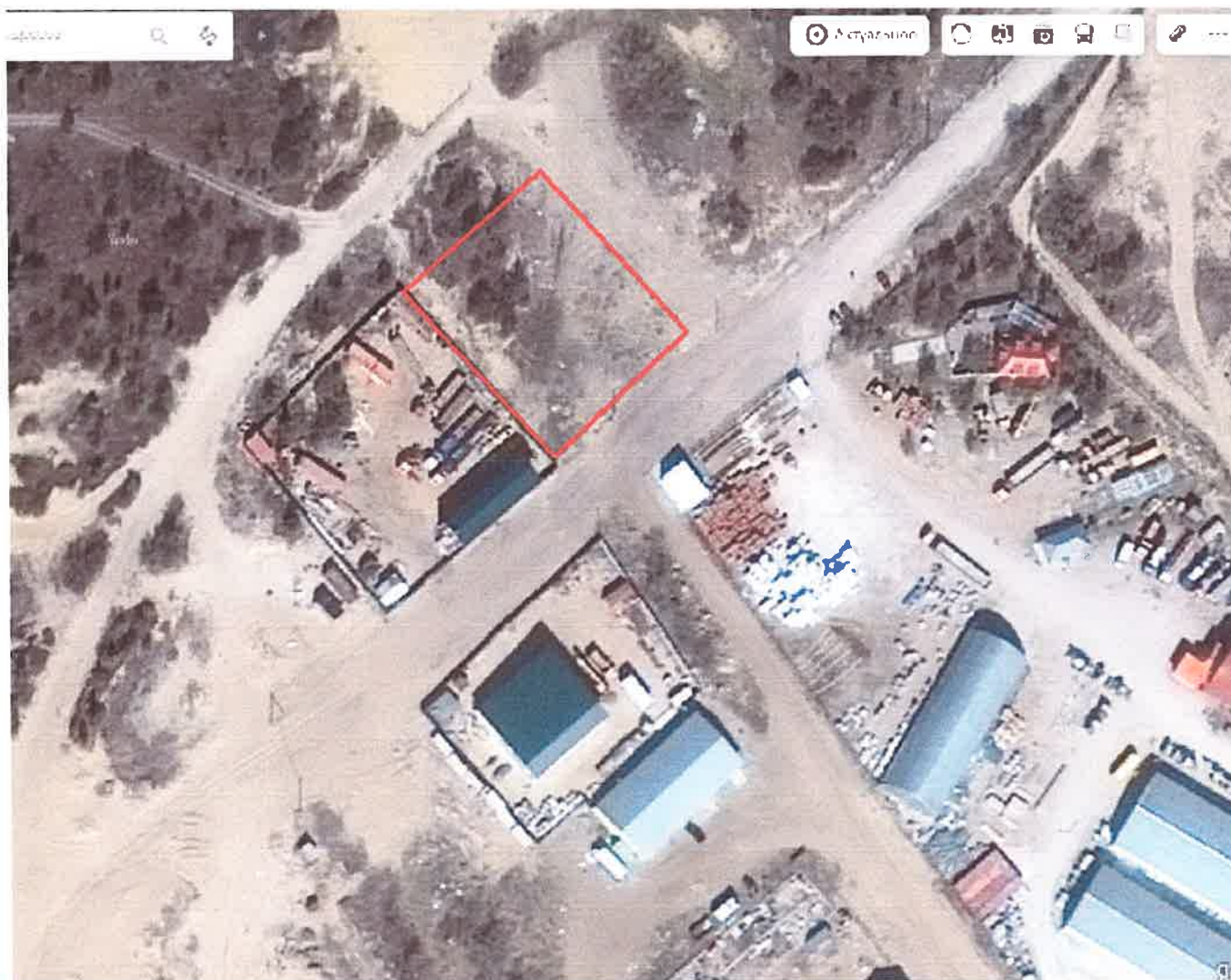
Каталог координат поворотных точек в МСК 83

Кадастровый номер исходных земель: 83:00:050039