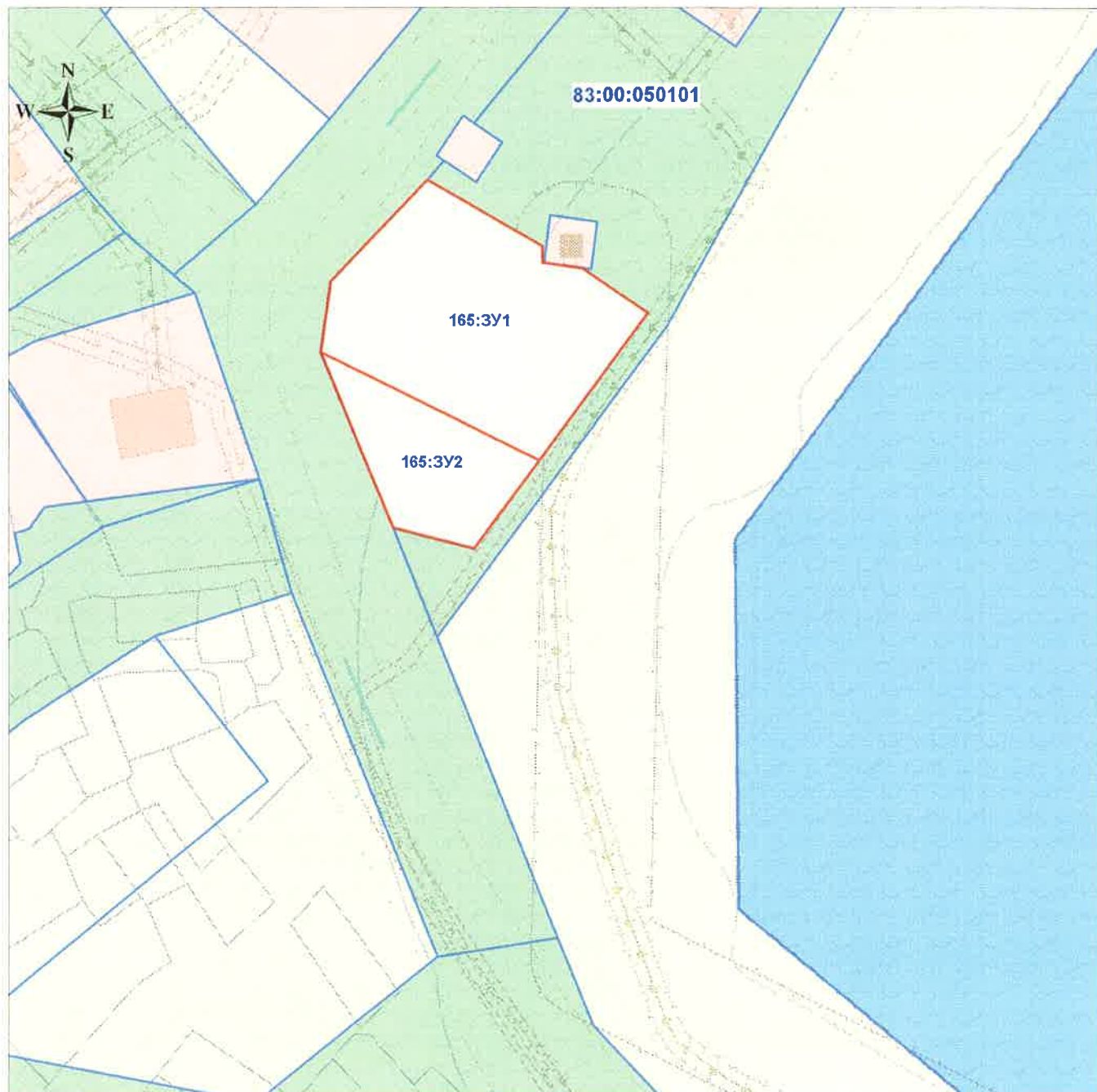
Схема границ изменяемой части проекта межевания территории муниципального образования "Городской округ "Город Нарьян-Мар" внесение изменений в планировочный квартал 165