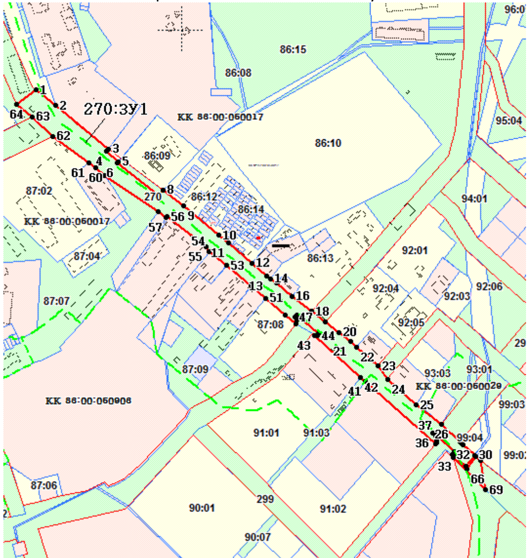
Схема расположения земельного участка