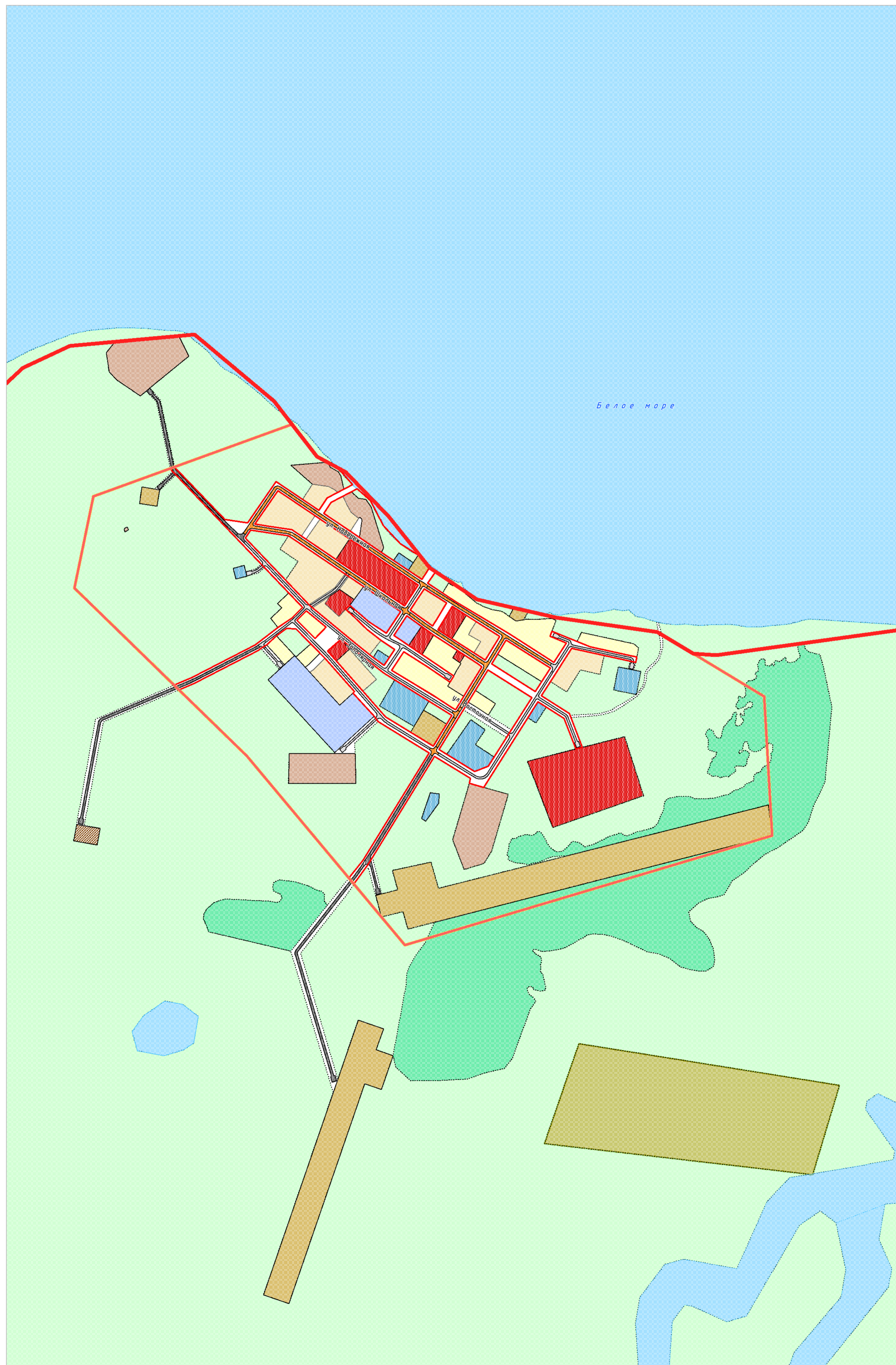
СИТУАЦИОННАЯ СХЕМА М 1:50 000

КАРТА ПЛАНИРОВОЧНОЙ СТРУКТУРЫ ТЕРРИТОРИИ ПОСЕЛЕНИЯ М 1:5 000