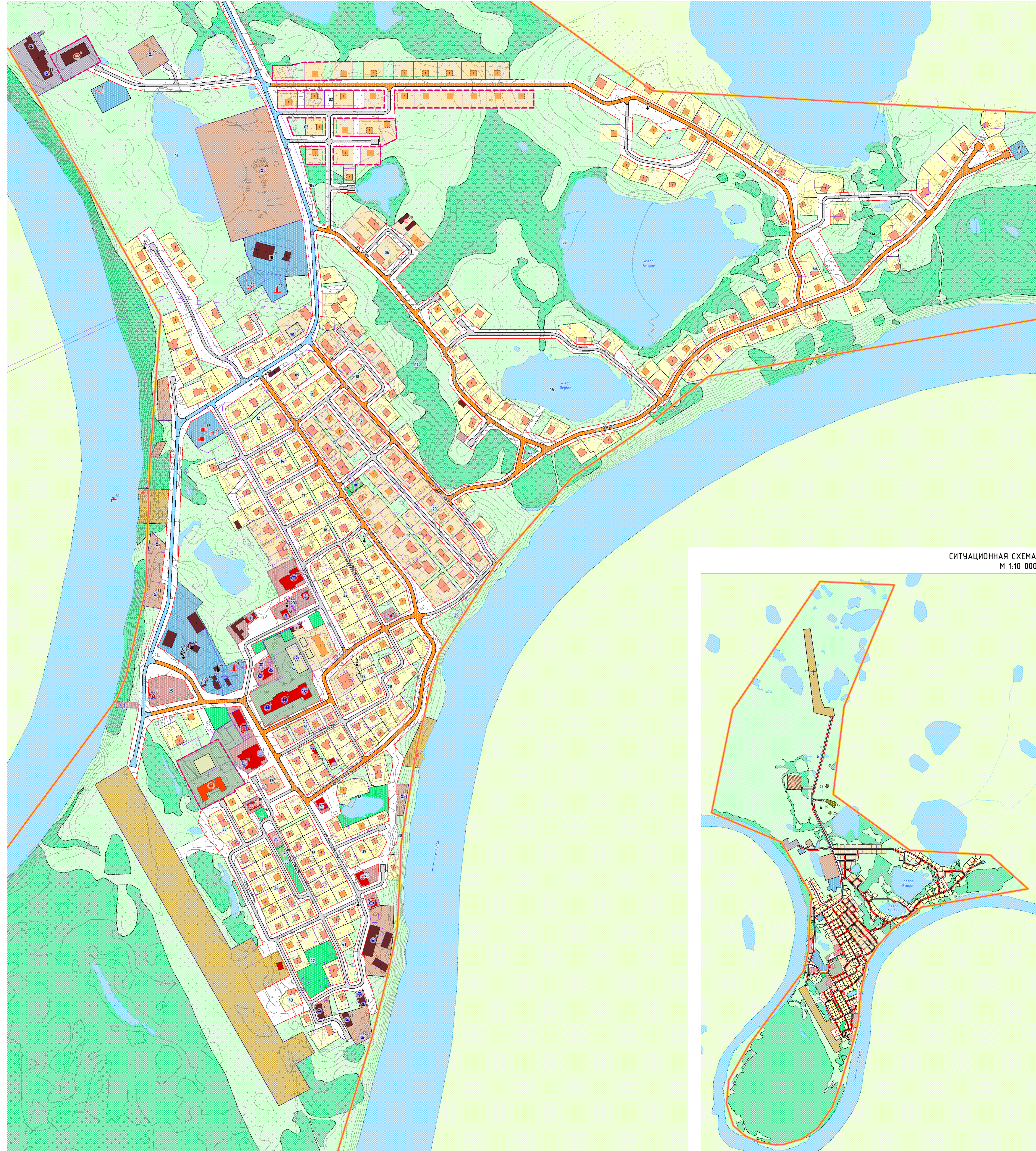
СИТУАЦИОННАЯ СХЕМА М 1:10 000

ВАРИАНТ ПЛАНИРОВОЧНОГО РЕШЕНИЯ ЗАСТРОЙКИ ТЕРРИТОРИИ М 1:2 000