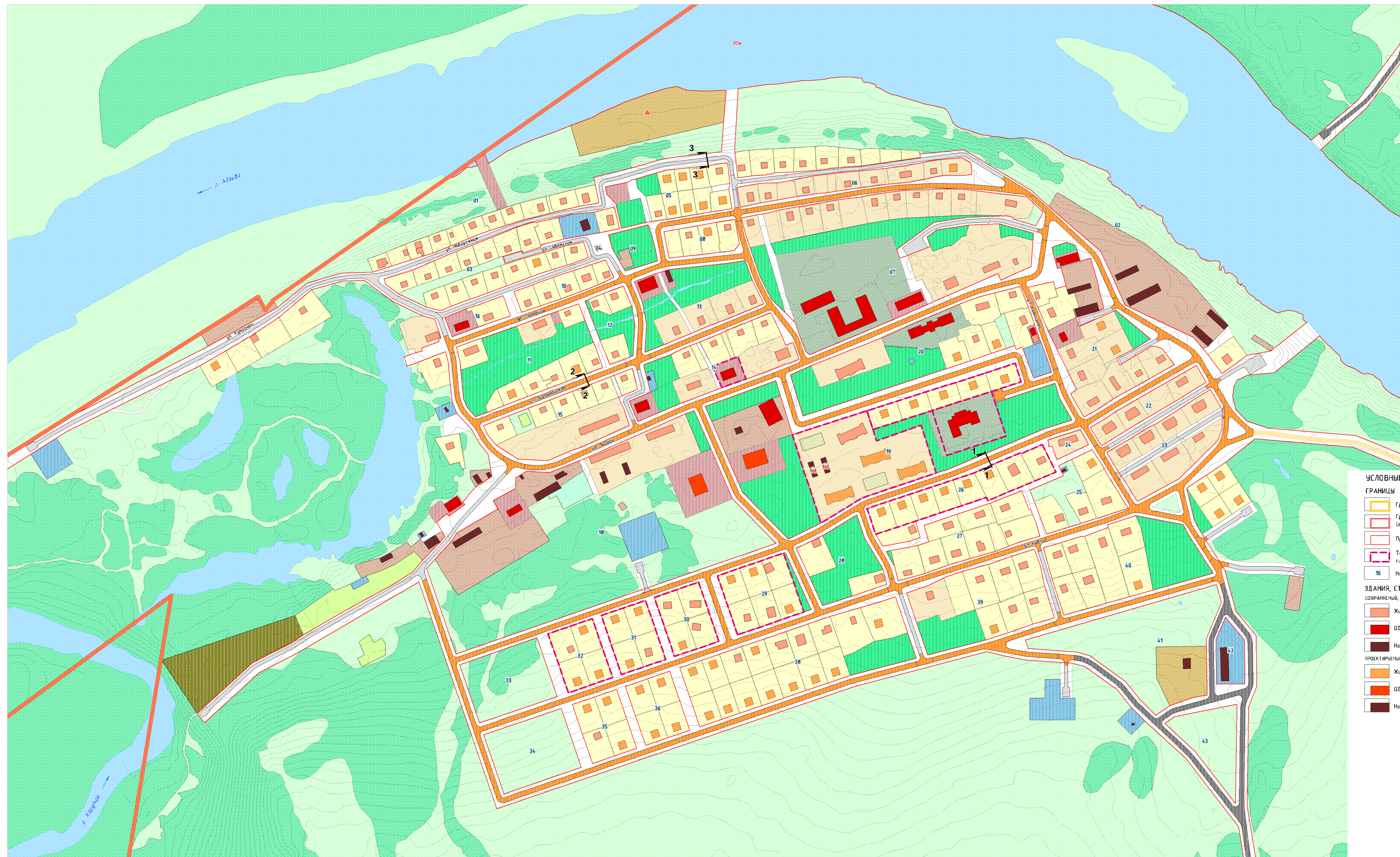
СХЕМА ОРГАНИЗАЦИИ ДВИЖЕНИЯ ТРАНСПОРТА И ПЕШЕХОДОВ. СХЕМА ОРГАНИЗАЦИИ УЛИЧНО-ДОРОЖНОЙ СЕТИ М 1:2 000