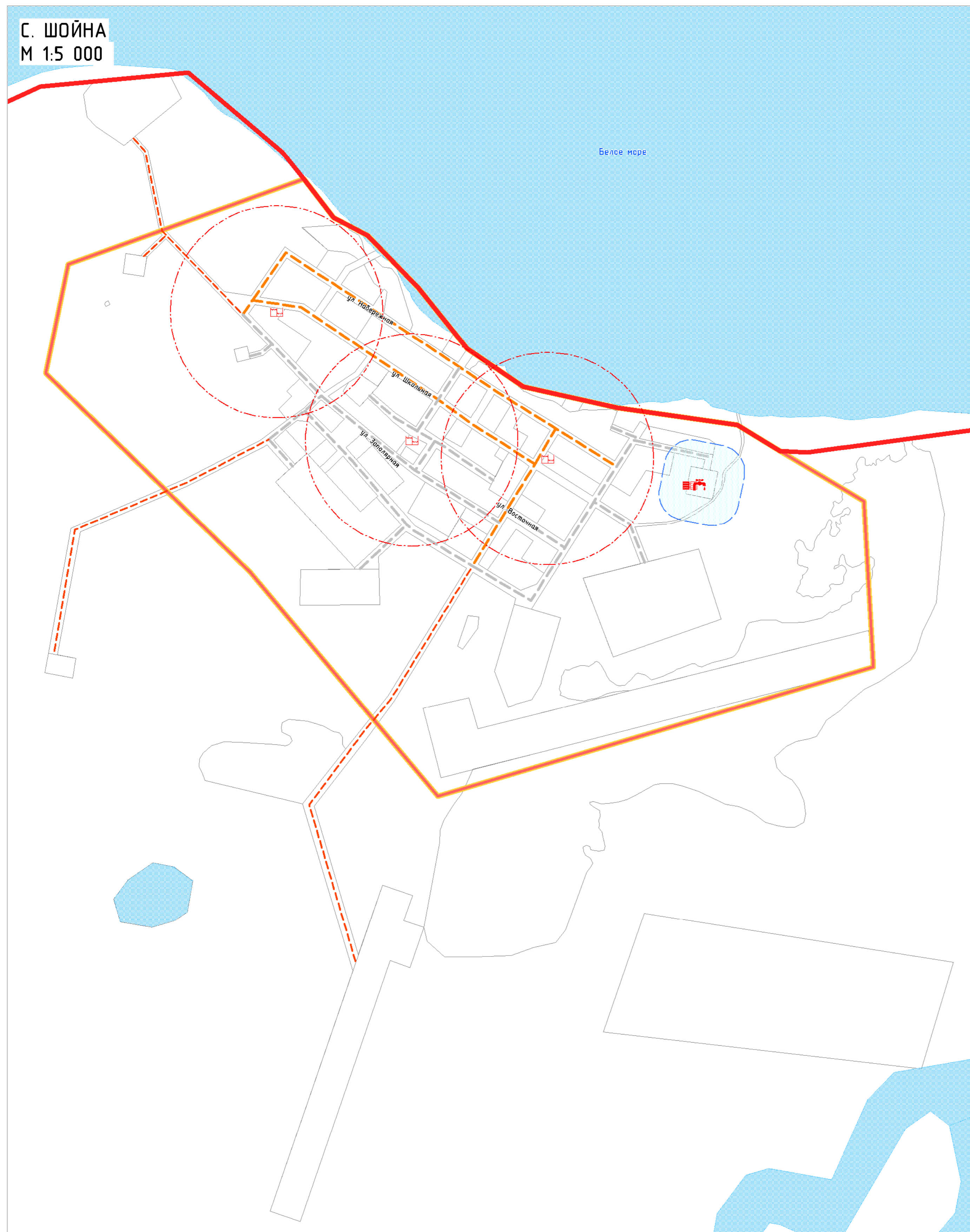
СХЕМА КОМПЛЕКСНОЙ ОЦЕНКИ ТЕРРИТОРИИ М 1:5 000