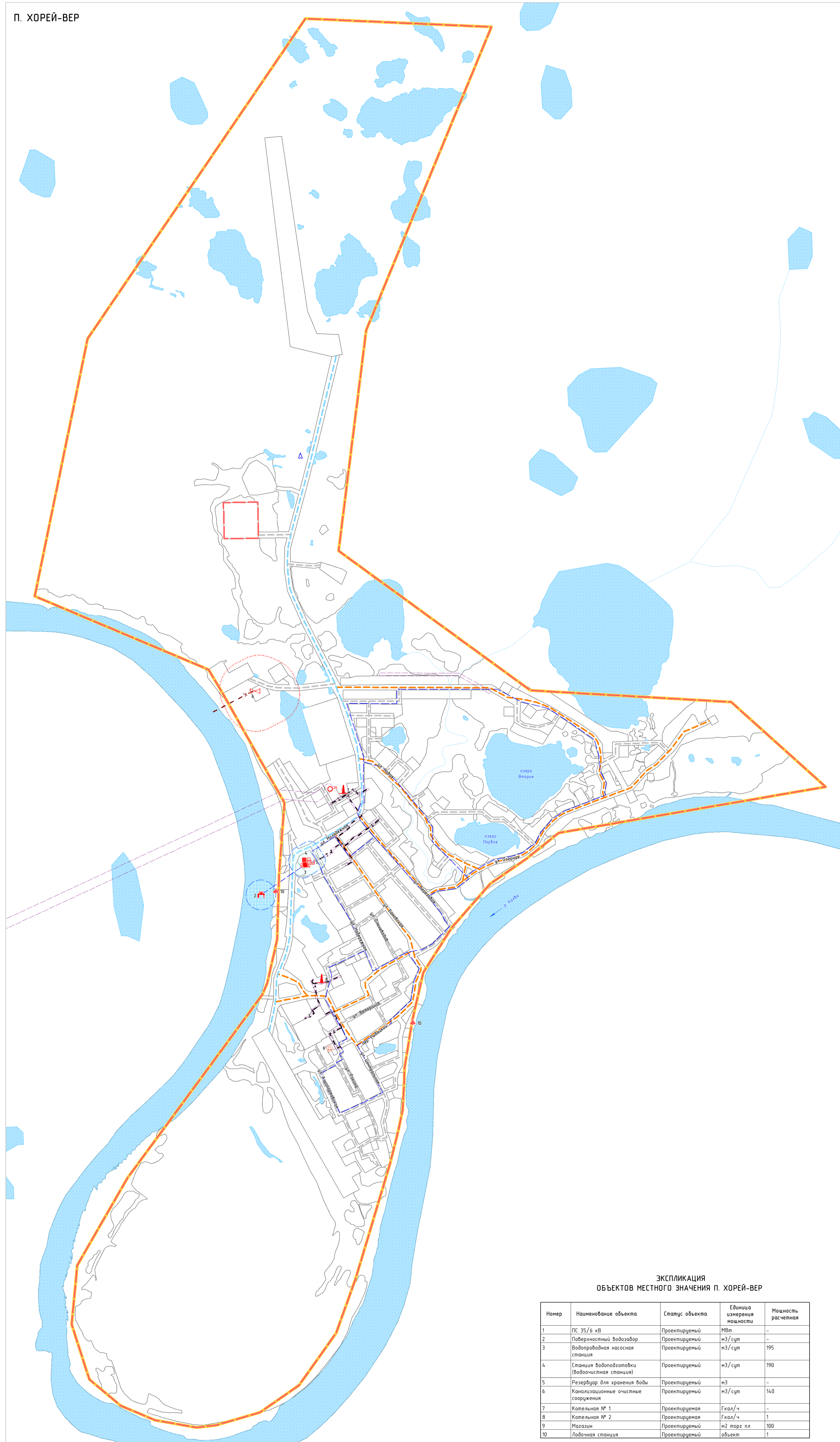
ЭКСПЛИКАЦИЯ ОБЪЕКТОВ МЕСТНОГО ЗНАЧЕНИЯ П. ХОРЕЙ-ВЕР