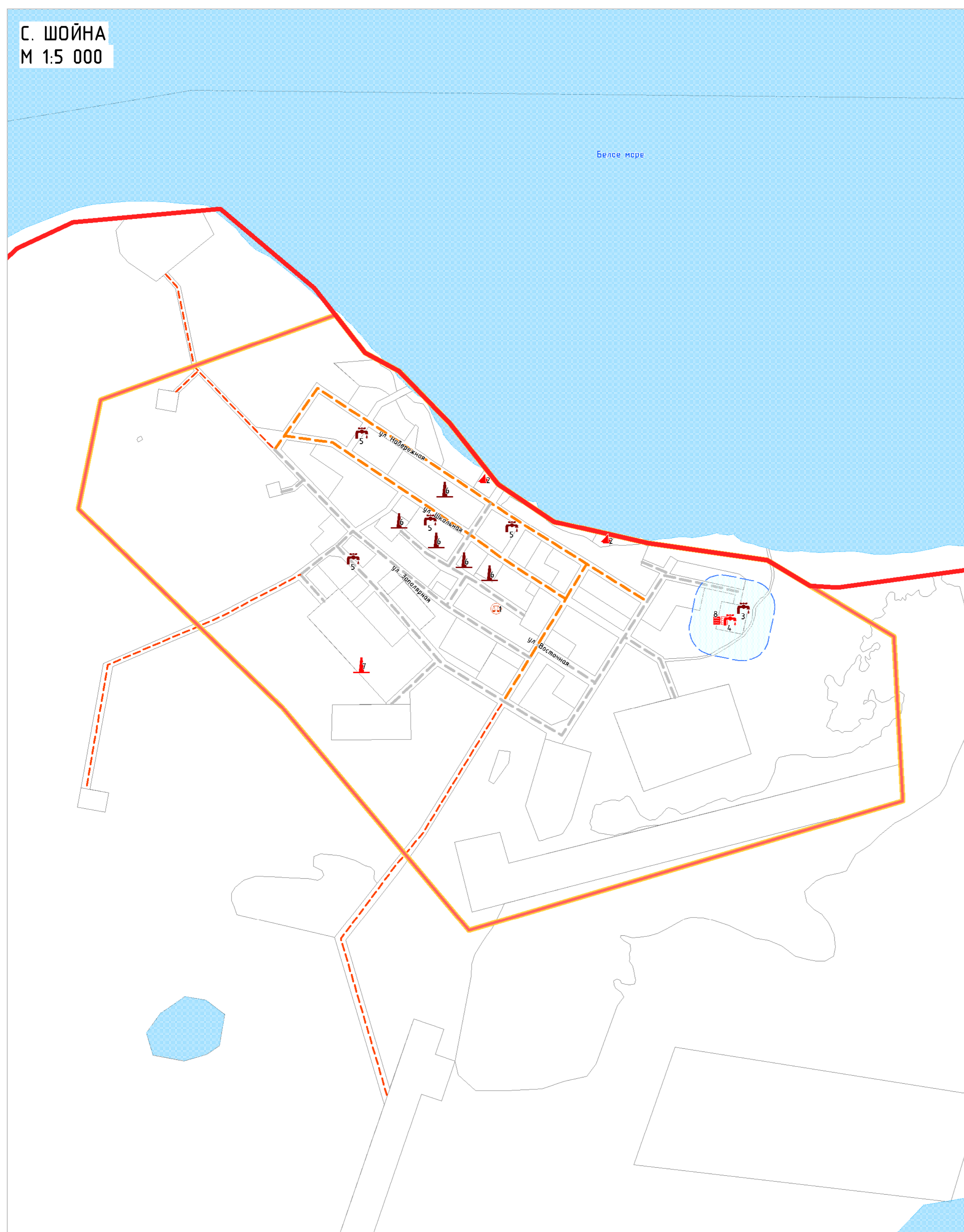
С. ШОЙНА М 1:5 000

КАРТА ПЛАНИРУЕМОГО РАЗМЕЩЕНИЯ ОБЪЕКТОВ МЕСТНОГО ЗНАЧЕНИЯ ПОСЕЛЕНИЯ М 1:5 000